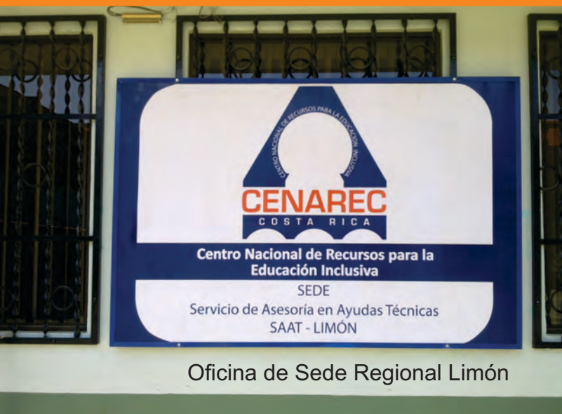
Oficina de Sede Regional Limón

El reto más importante es continuar contribuyendo al desarrollo de las personas con discapacidad desde el marco de la educación inclusiva, potenciando cada uno de los servicios en las regiones de manera que se brinde una cobertura a nivel regional y nacional.