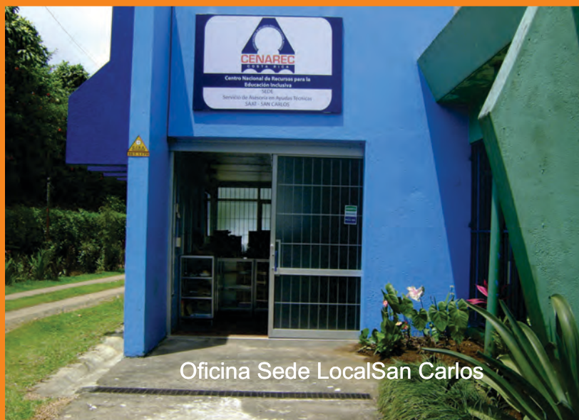
Oficina Sede Local San Carlos