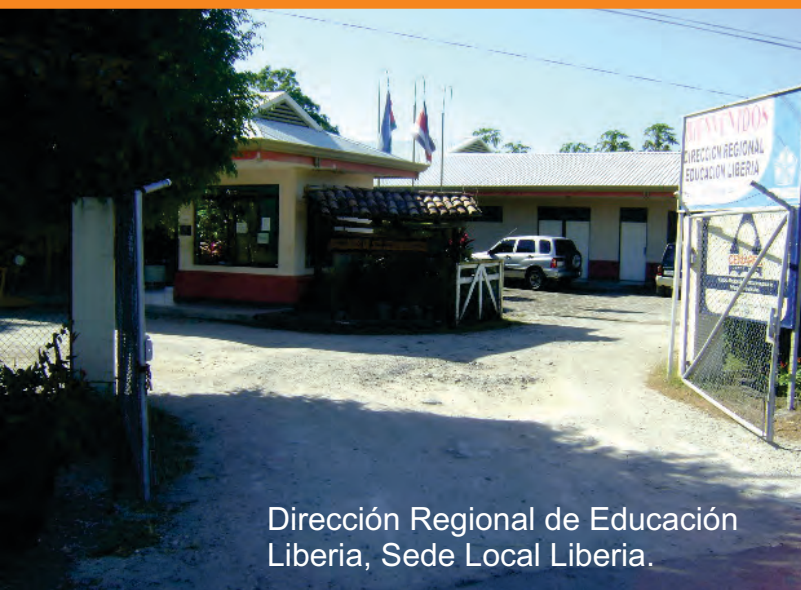
Dirección Regional de Educación Liberia, Sede Local Liberia.

Las Sedes han enfocado esfuerzos en la detección de apoyos para la asesoría y recomendación de ayudas técnicas, así como la divulgación de los mismos; de igual manera, se ofrecen servicios gratuitos, entre los cuales destacan: asesoría en ayudas técnicas, préstamo de equipo para uso de software, elaboración y emplastado de pictogramas, uso de software para el apoyo en áreas visual y motora (Jaws, Zoomtext y Dragon Naturally Speaking, entre otros), impresión en Braille, realce de imágenes, magnificador de imágenes, préstamo de ayudas técnicas en procesos de asesoría a estudiantes, como por ejemplo: teclados, mouse, atriles, cuadernos electrónicos, comunicadores, entre otros.