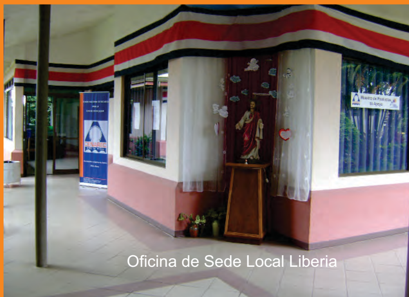
Oficina de Sede Local Liberia